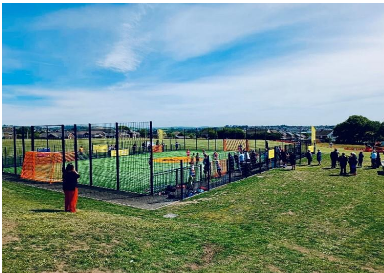
Cwrt Cruyff, Penyfan

Yn ystod cyfnod yr haf 2022, bu'r Cyngor Tref yn rheoli padiau sbasio a phyllau padlo ym Mharc y Goron, Parc Havelock, Parc Howard a Pharc Penyfan, a bu'r rhain unwaith eto yn atyniadau poblogaidd iawn drwy gydol y cyfnod. Ymhlith y cyfleusterau a reolir gan Gyngor y Dref mae Cwrt Cruyff ym Mharc Pen-y-fan, Parciau Sglefrio ym Mharc y Morfa a Pharc y Bobl a chaeau chwarae ym Mhenygaer.