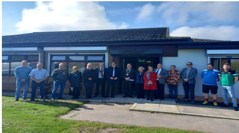
Ail agor Ystafelloedd Newid Penygaer yn Ail-agor

Mae'r Cyngor Tref yn parhau i fuddsoddi yn y manau chwarae yn y Gymuned gyda rhaglen cynnal a chadw yn ei lle ac ymweliadau dyddiol gan ein Ceidwaid Parc a Staff y Tiroedd i bob lleoliad. Ceisir yn barhaus i gael cyfleoedd i gyflawni prosiectau gwella. Yn ystod y flwyddyn, mae gwella arfaethedig i gyfleusterau'r Ystafelloedd Newid ym Mhenygaer wedi'u cwblhau. Mae'r prosiect wedi gweld datblygiad gofod cymunedol newydd a thoiled Changing Places .