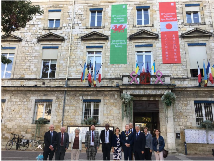
Trefnwyd ymweliad hefyd ag Ysgol Simone Veil yn Agen.