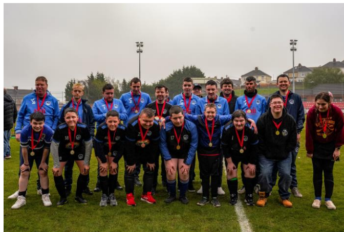
Gŵyl Pêl-droed Anabledd Llanelli 2023