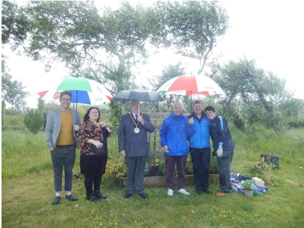
Prosiect Amgylcheddol Parc y Goron