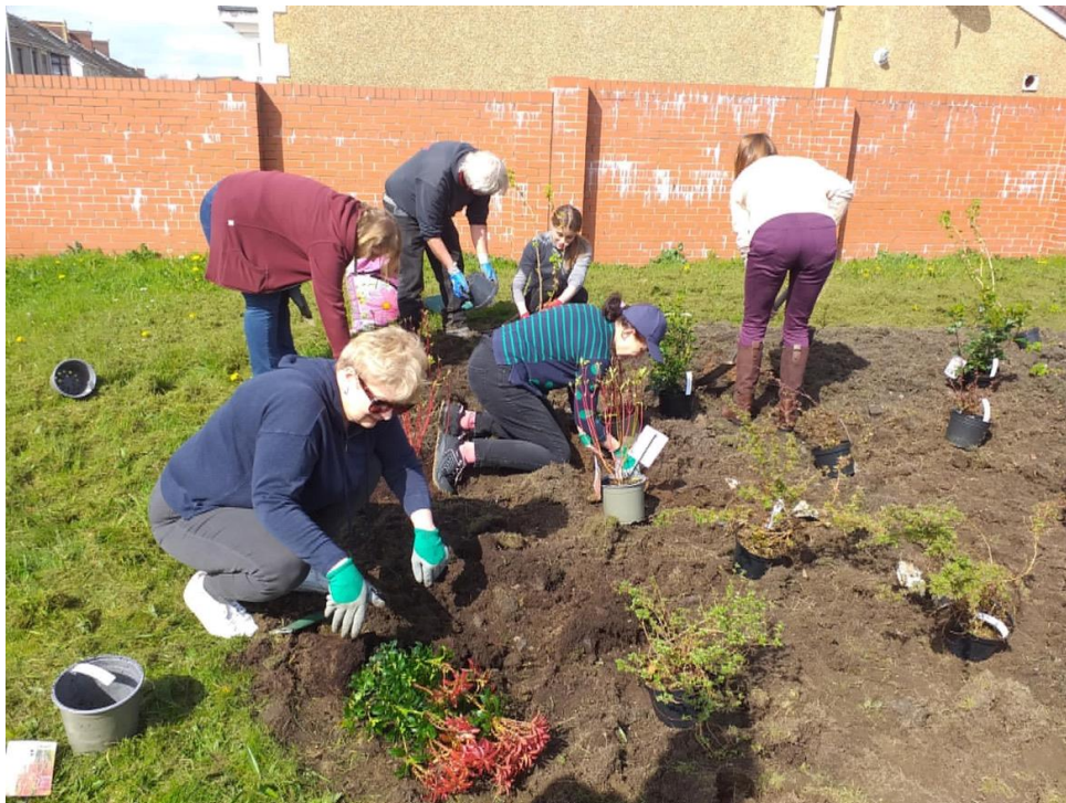
Prosiect Plannu yn Bryn Yard