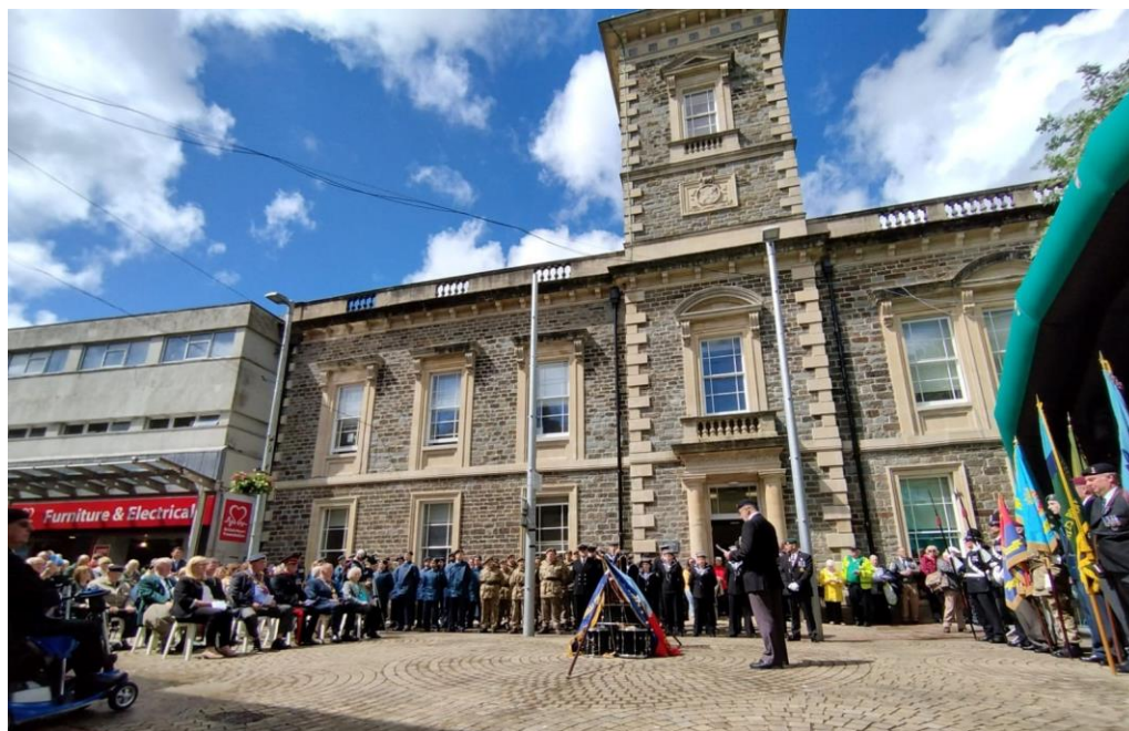
Diwrnod y Lluoedd Arfog 2022

Roedd Cymdeithas Cyn-filwyr Llanelli hefyd yn gallu cefnogi trefniadau ar gyfer Seremoni Gyhoeddi Ei Fawrhydi, y Brenin Siarl III.