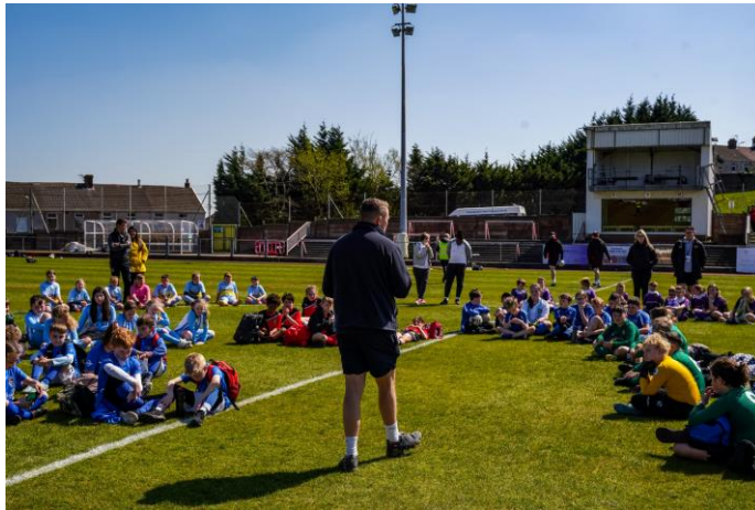
Gŵyl Bêl-droed ym Mharc Stebonheath 2023